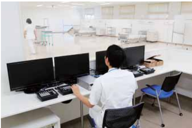
■ ホスピタルスタジオ