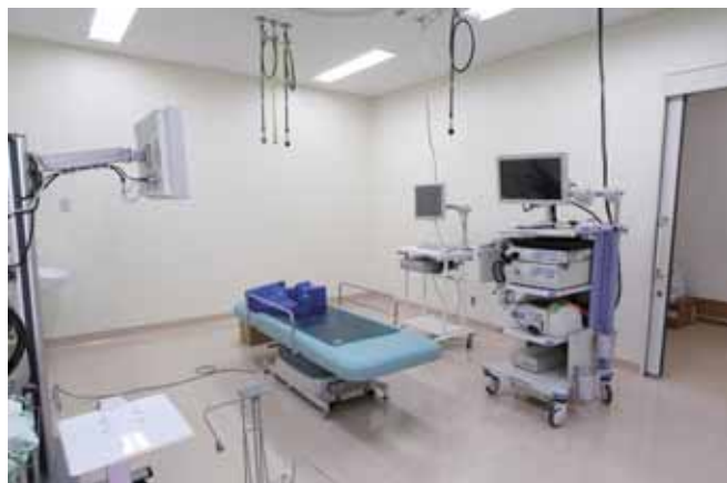
■ 外来内視鏡センター