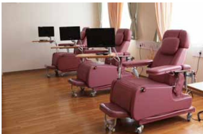
■ 外来化学療法センター