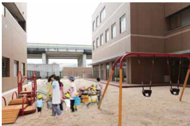
■ 保育所 くるみ園